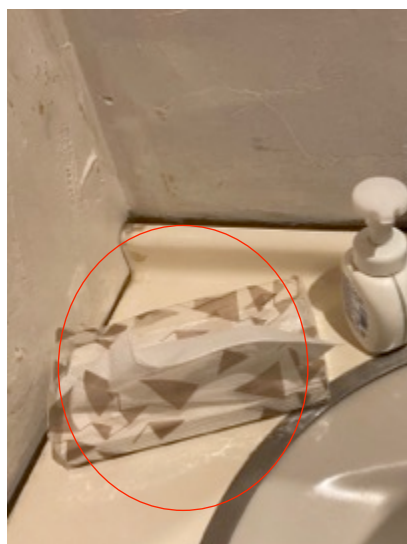
ハンドドライヤーの使用を止め、ペーパータオルを設置