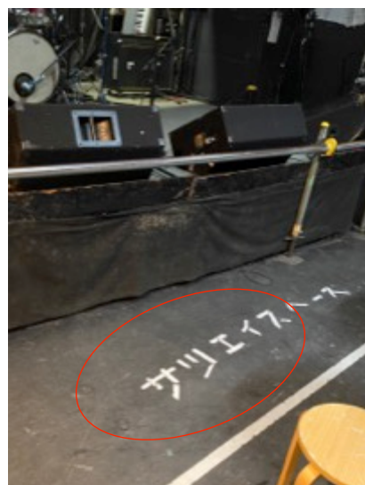
ステージと客席最前列の間を空けるよう白線を引く