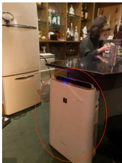
ドアと窓を開けて換気と 空気清浄機の併用