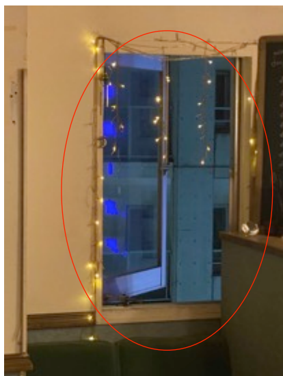
窓を開放しての常時換気