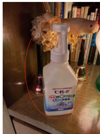
入口に手指消毒用のアルコールを 設置