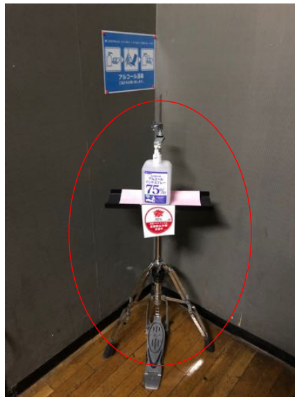
手指消毒用アルコールの設置 (ハイハットスタンドを利用し 足でプッシュできるもの)