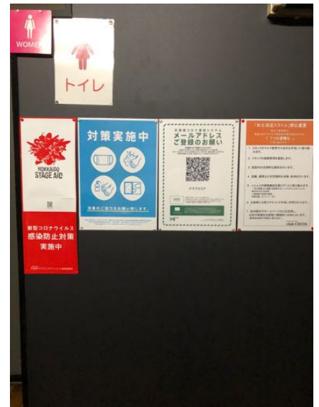
感染拡大防止の取り組みを掲 示