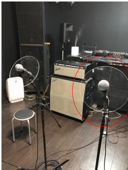
マイクにアクリル板を設置し、 飛沫感染防止対策