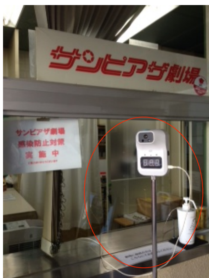
入場口に検温機と手指消毒液を設置