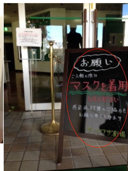
来場者へのマスク着用を促すよう入場口前に掲示