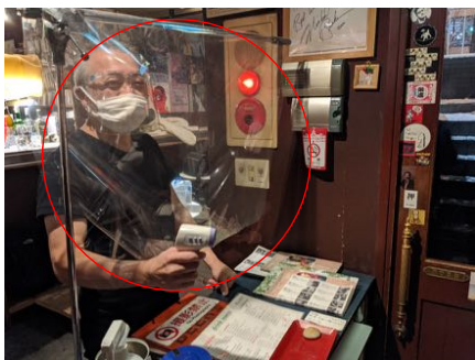
対面になる箇所にビニールの設置