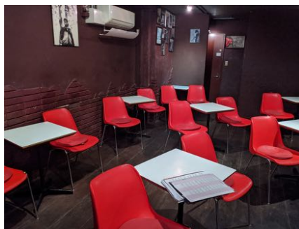
座席の距離をあけて営業