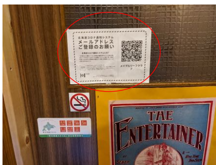
北海道コロナ通知システム登録QRコードの掲示