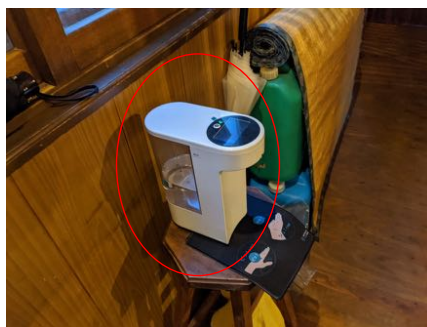
入店時の手指消毒 (自動消毒機の設置)