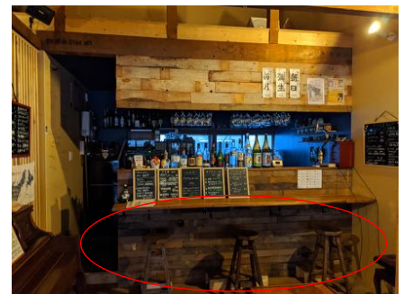
座席数の減少、間隔を置いての着席のお願い