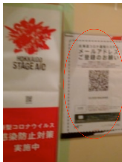
来場者の北海道コロナ通知シ ステムの登録の徹底