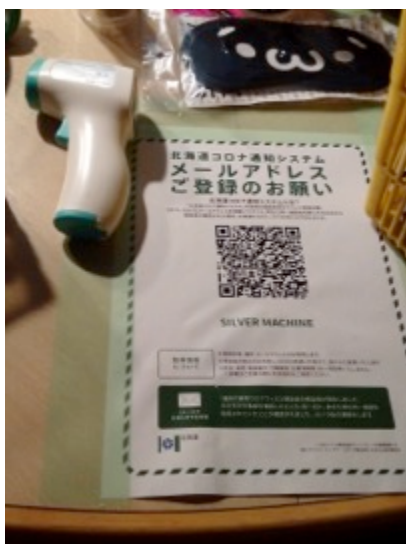
スタッフの在宅時の検温、 店舗入場前検温、 行動経路確認と 新しいマスク着用徹底