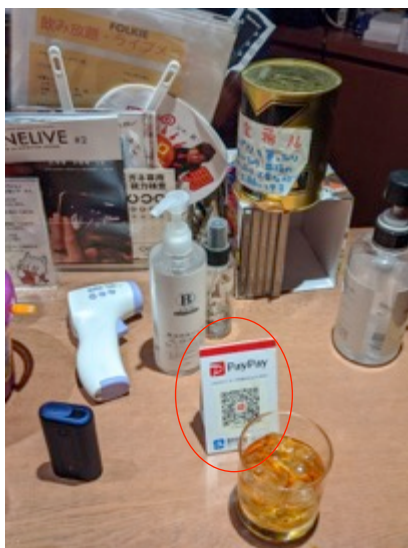
キャッシュレス決済の使用