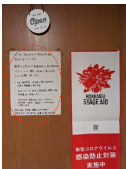
掲示物による感染症拡大防止の取り組みをお客様に周知してもらう