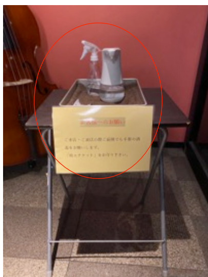
店舗入り口に手指消毒液を設置し、来場者の消毒を徹底