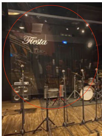
ステージ前に透明なスクリーンを設置し、客席の間を遮蔽する