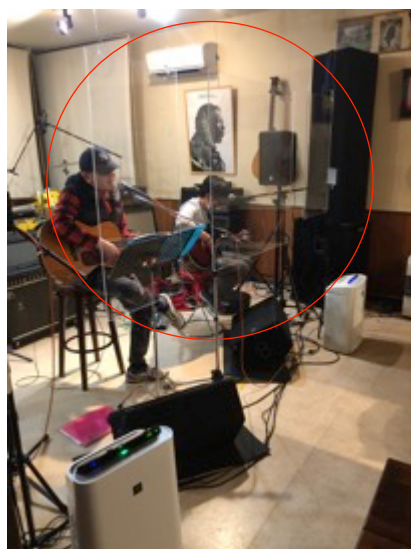
演者ステージと客席の間に アクリル板 設置