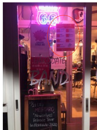
来場者に向けて、 感染拡大防止の周知と取り組みの徹底