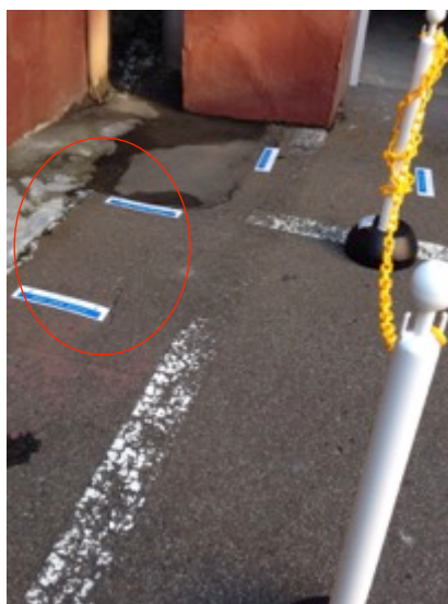
整列の際、距離を確保するための基準点の設置