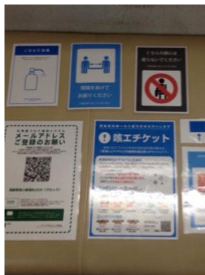
掲示物による感染症拡大防止の取り組みをお客様に周知してもらおう