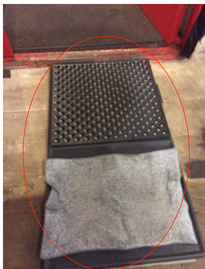
入場口に靴用消毒マット設置