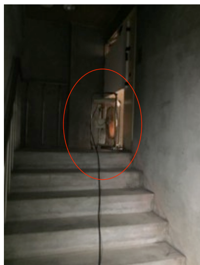
全ての扉と窓の開放し、常時換気(換気口の増設、サーキュレーターの増設)