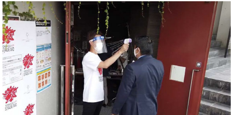
消毒・検温の実施